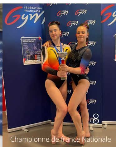
Championne de France Nationale